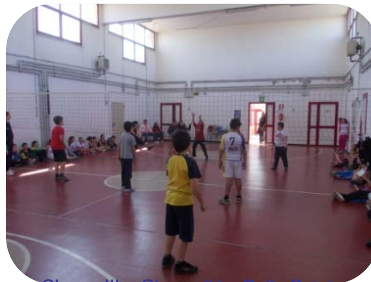
Classe III e Classe IV – Palla Spinta