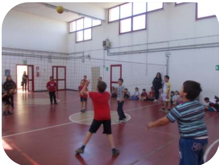
Classe III e Classe IV – Palla Spinta