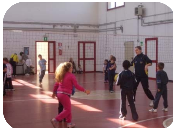
Classe I e Classe II – Palla Bloccata