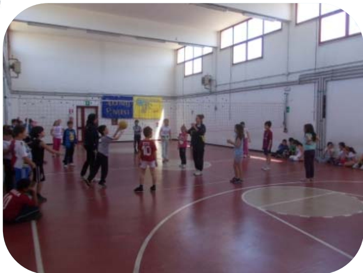
Classe IV e Classe V – Gioco