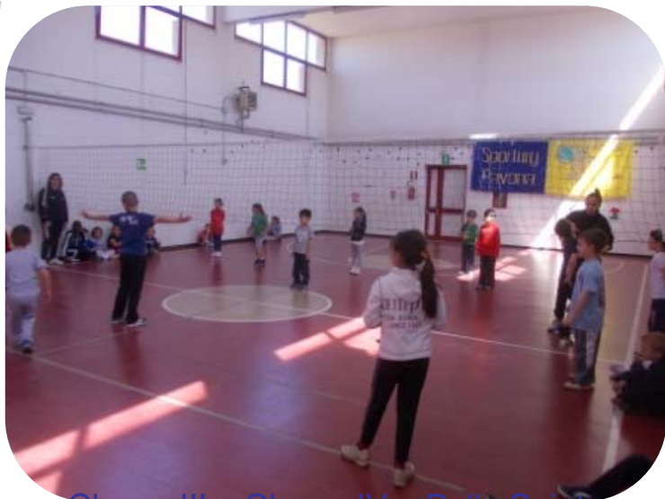
Classe III e Classe IV – Palla Spinta