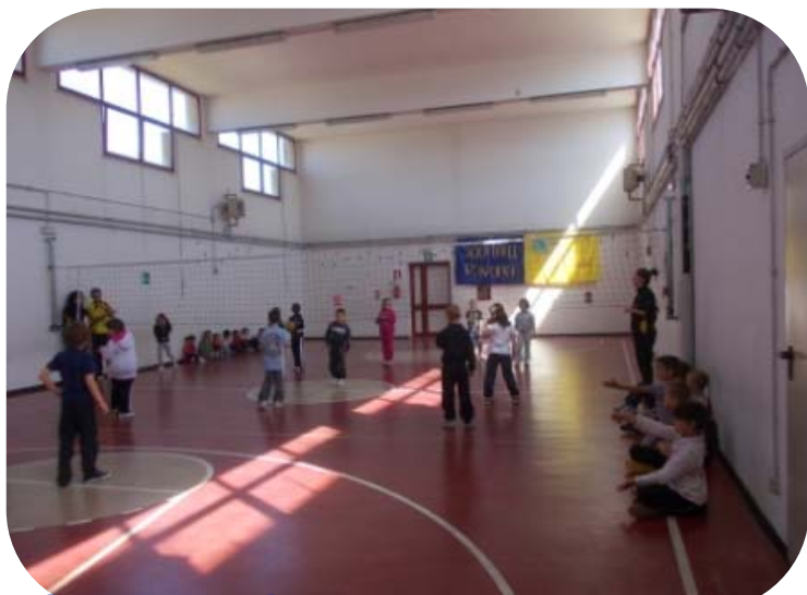
Classe I e Classe II – Palla Bloccata