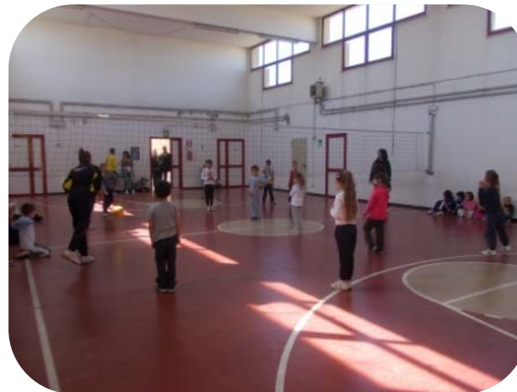
Classe III e Classe IV – Palla Spinta