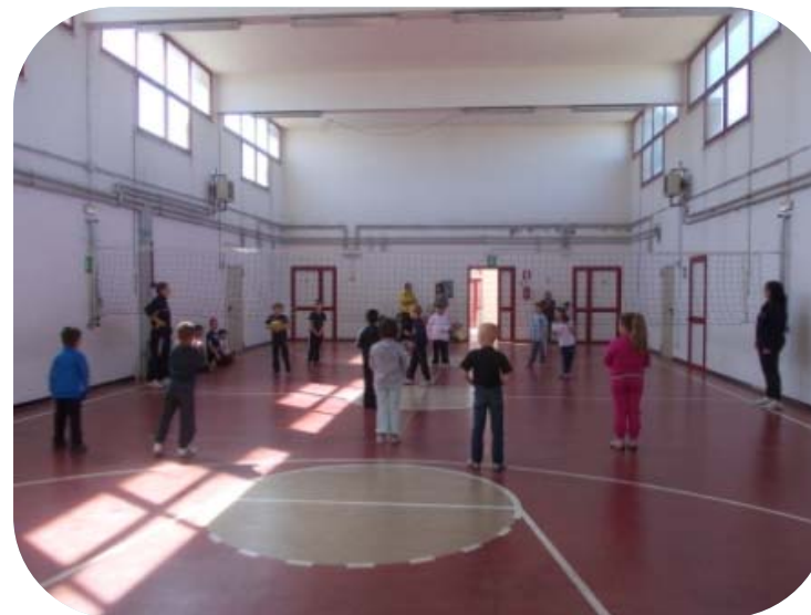
Classe I e Classe II – Palla Bloccata