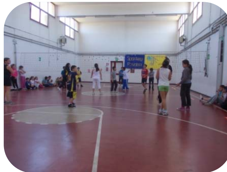
Classe IV e Classe V – Gioco